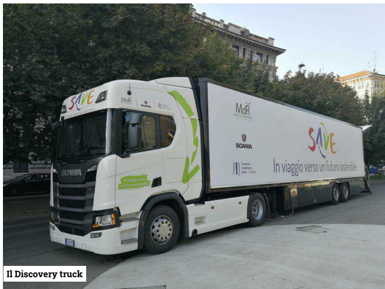
Il Discovery truck

edizione che ha visto il coinvolgimento di oltre 10.000 studenti in otto regioni , quest'anno il progetto vedrà una partecipazione ancora maggiore, anche grazie a un protocollo di intesa sottoscritto con il MIUR, il Ministero dell'Istruzione, dell'Università e della Ricerca .